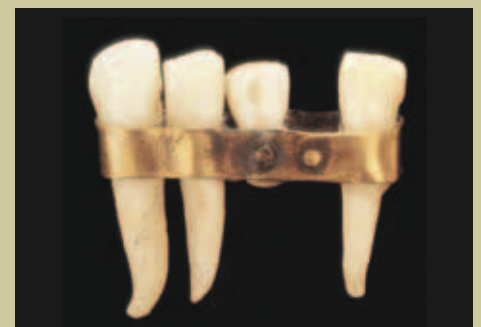
Etruskischer Zahnersatz, ca. 400 vor Christus

Immer wieder versuchten Mediziner, Zähne zu replantieren. Nennenswerte Fortschritte wurden dabei nicht erzielt. Erst 1939 legte Strock an der Harvard-Universität den Grundstein der modernen zahnärztlichen Implantologie. Er veränderte das Design der Implantate, gab ihnen eine der Holzschraube sehr ähnliche Gewindeform und verwendete eine Chrom-Kobalt-Molybdän-Legierung.